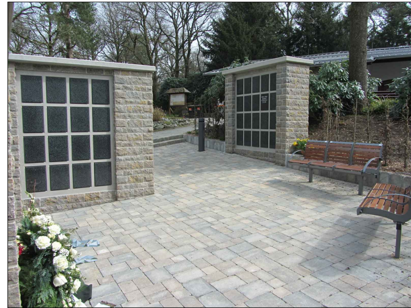
Beispiel Urnenkolumbarien Waldfriedhof Reinshagen