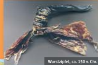
Wurstpfeil, ca. 150 v. Chr.

Eine Kulturgruppe der mittleren Steinzeit vor etwa 10.000 Jahren erhielt ihren Namen von ihrem Abfall – die Kjökkenmöddinger. Die „Küchenabfallleute“ lebten an den Küsten Skandinaviens und der britischen Inseln und ernährten sich hauptsächlich von Schalentieren. Die Schalenreste warfen sie direkt neben ihre Häuser, bis diese im Abfall versanken. Danach wurden die Wohnstätten auf dem Abfallberg erhöht, bis man sie schließlich aufgab und an der Küste ein Stück weiterzog, um eine neue Siedlung zu gründen.