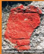
Bricksiegel aus Aschfänger-Labrine