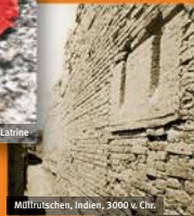
Müllrutschen, Indien, 3000 v. Chr.