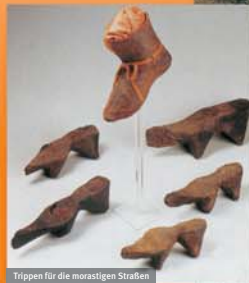
Trippen für die morastigen Straßen

Handwerker und anderes Gewerbe durften sich oft nur in bestimmten Stadtteilen ansiedeln, um in den „Wohngebieten“ Lärm und Gestank zu vermeiden und eine schnelle Abfallbeseitigung, z.B. durch Fließgewässer, sicherzustellen. Die Schlachter und Abdecker wurden gänzlich vor die Stadt verbannt.