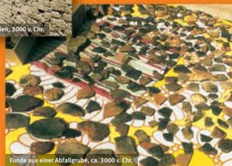
Funde aus einer Abfallgrube, ca. 3000 v. Chr.