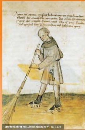
Straßenkehrer mit „Stöckelschuhen“, ca. 1434

Eine wirksame Müllabfuhr hielt erst ab der 2. Hälfte des 19. Jahrhunderts Einzug in die Städte Deutschlands. Im ausgehenden Mittelalter gab es, z.B. in Göttingen, ein „Dreckgeld“ (eine Müllgebühr), das für die Abfallbeseitigung erhoben wurde. Straßenkehrer gab es ab dem Mittelalter.