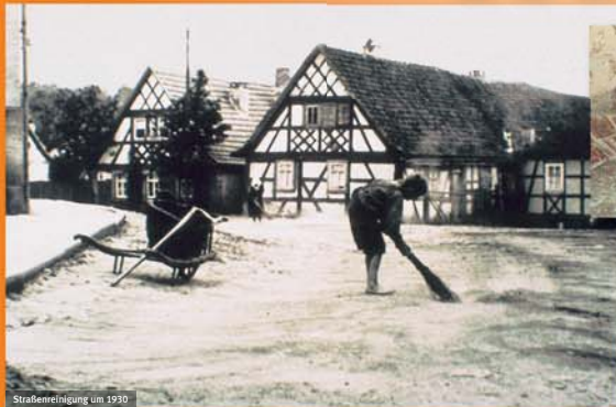
Straßenreinigung um 1930