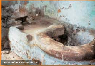
Ausguss-Stein in einer Küche

Auf dem Land wurden fast alle Abfälle und Abwässer auf dem Misthaufen, der Straße und direkt in Flüsse und Bäche entsorgt. Verendete Kleintiere, Schlachtabfälle, Knochen, organische Reste und Tonscherben wurden auf diese Weise beseitigt. Scherbenscheier und Knochenreste auf den Feldern weisen noch heute darauf hin.