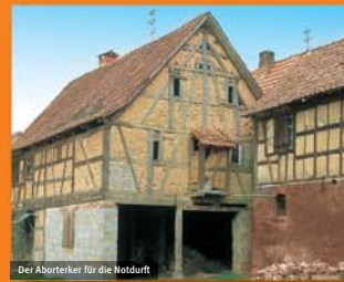
Der Aborterker für die Notdurft

Die in der Regel unbefestigten Straßen wurden durch Abwässer und Haustierkot verschmutzt. Eine gezielte Straßenreinigung war schwierig, da die Befestigung von Straßen oft erst im 20. Jahrhundert vorgenommen und Seitenstraßen meist erst in der Nachkriegszeit einen festen Belag erhielten.