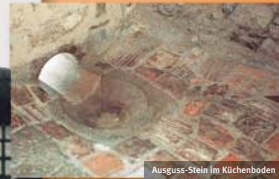
Ausguss-Stein im Küchenboden

In ländlichen Gebieten gab es nur wenige zentrale Deponien. Viele Dörfer hatten eine Kuhle, einen Steinbruch oder einen anderen Platz, an dem die Abfälle anfangs von den Bürgern selbst und später durch einen Abfuhrunternehmer gebracht wurden. Solche Müllhalden lassen sich auch im Bergischen noch belegen, auch wenn mittlerweile „Gras darüber gewachsen ist“. Nicht selten müssen solche Plätze heute saniert werden, da von ihnen eine Umweltgefährdung ausgehen kann.