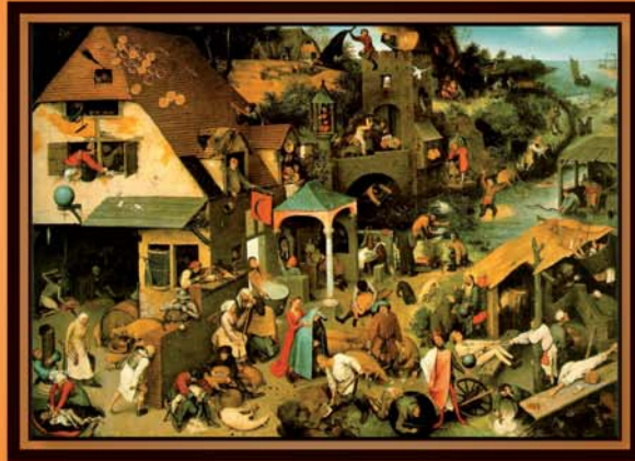
Die niederländischen Sprichwörter Pieter Bruegel der Ältere 1559 – Öl auf Leinwand (Berliner Gemäldegalerie)