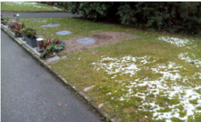
Wahrasengräber auf dem Waldfriedhof Lennep