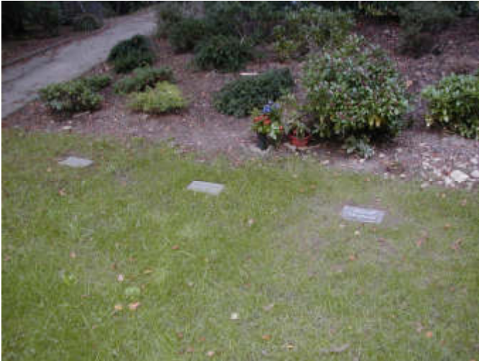
Reihenrasengrabfeld auf dem Waldfriedhof Reinshagen