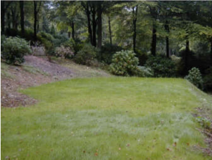
Gemeinschaftsfeld für Aschen auf dem Waldfriedhof Reinshagen