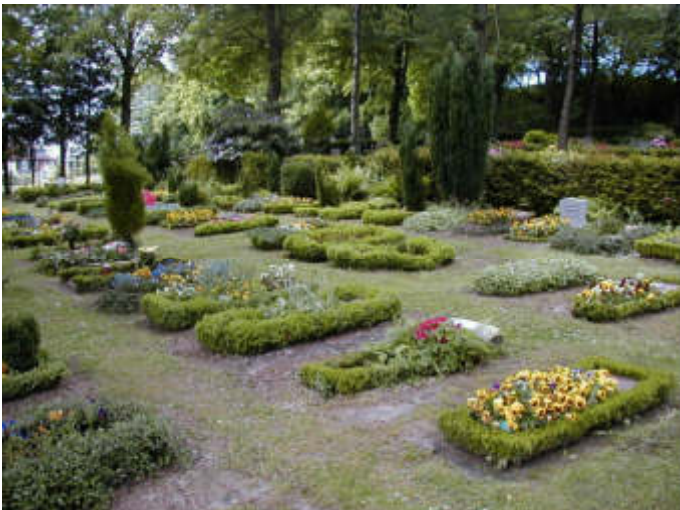
Reihengräber auf dem Parkfriedhof Bliedinghausen