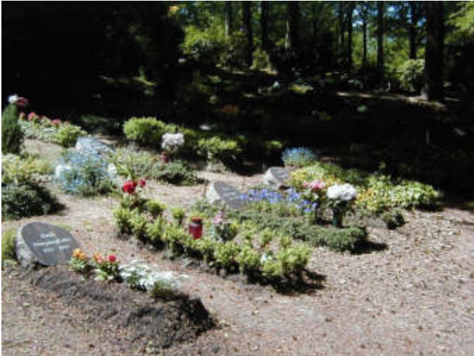
Reihengräber auf dem Waldfriedhof Reinshagen