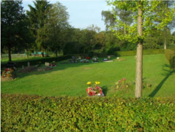
Grabfeld für muslimische Bestattungen auf dem Parkfriedhof Bliedinghausen