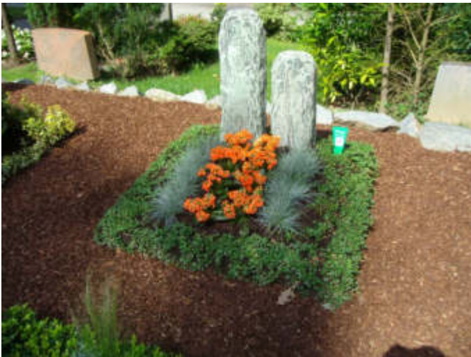
Mustergrab auf dem Waldfriedhof Reinshagen