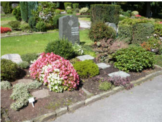
Wahlgräber auf dem Waldfriedhof Lennep