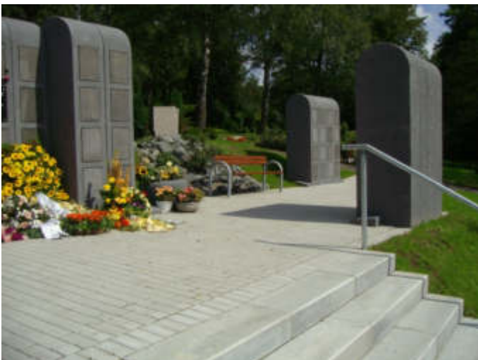
Urnenstelen auf dem Parkfriedhof Bliedinghausen