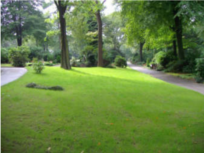
Urnen-Wahrasengräber auf dem Waldfriedhof Reinshagen