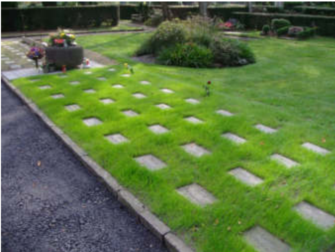
Urnen-Reihenrasengräber auf dem Parkfriedhof Bliedinghausen