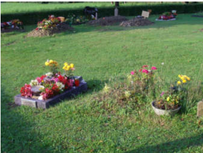
Grabfeld für muslimische Bestattungen auf dem Parkfriedhof Bliedinghausen, im Vordergrund die Kindergräber