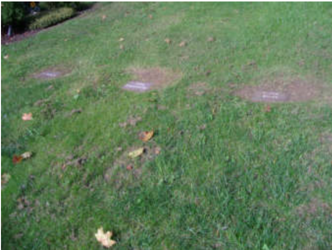
Reihenrasengräber auf dem Waldfriedhof Lennep