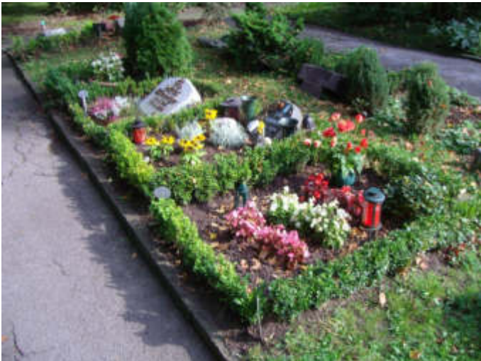
Urnenreihengräber auf dem Parkfriedhof Bliedinghausen