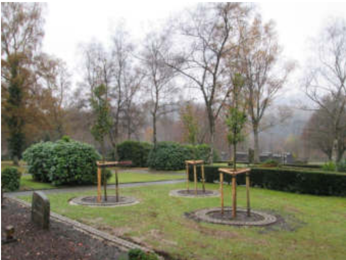
Urnen-Wahrasengräber mit besonderer Gestaltung auf dem Parkfriedhof Bliedinghausen