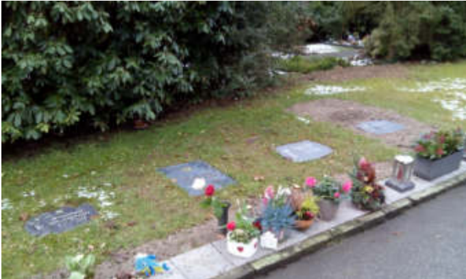
Wahrasengräber auf dem Waldfriedhof Lennep