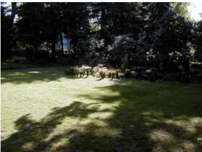
Gemeinschaftsfeld für Urnen auf dem Waldfriedhof Lennep