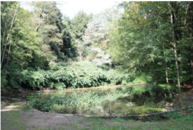
Der Begräbniswald „Im Kempkenholz“