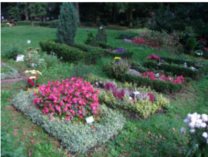
Reihengräber auf dem Waldfriedhof Lennep