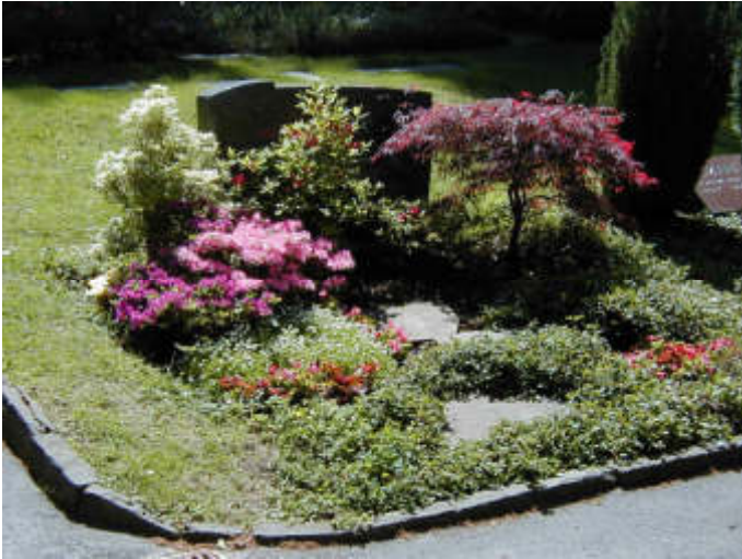
Wahlgrabstätte auf dem Waldfriedhof Reinshagen