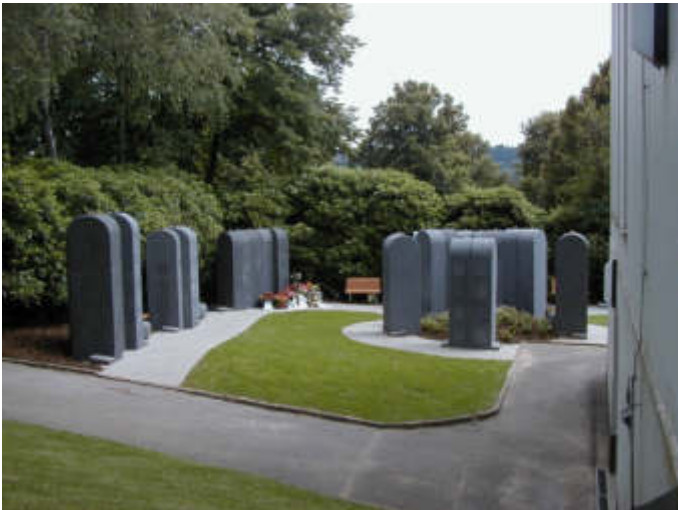
Urnenstelen auf dem Parkfriedhof Bliedinghausen