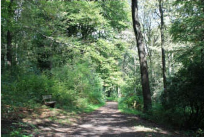
Der Begräbniswald „Im Kempkenholz“