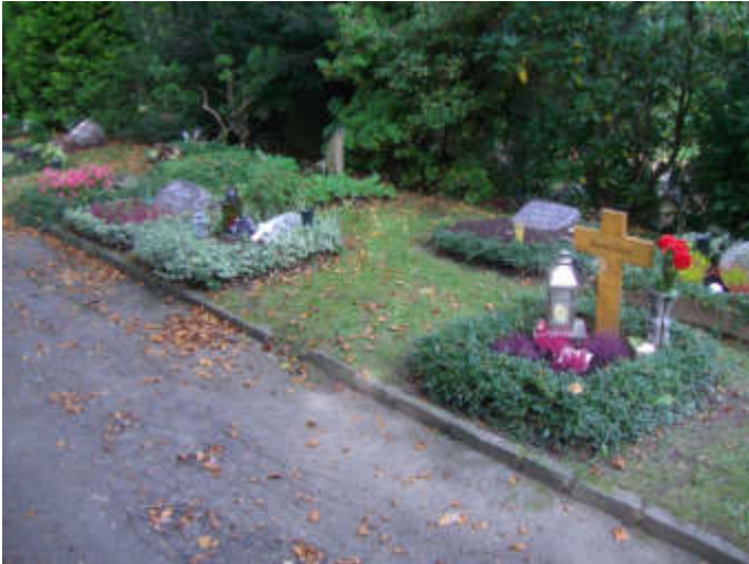
Urnenreihengräber auf dem Waldfriedhof Reinshagen