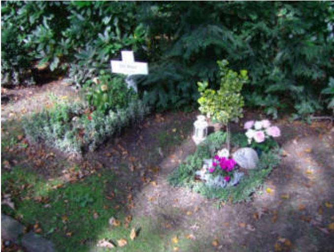
Kinder-Reihengräber auf dem Waldfriedhof Reinshagen