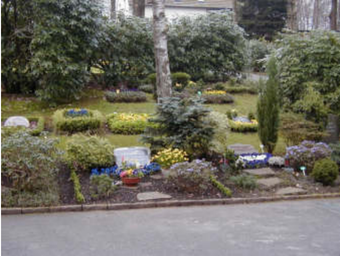
Urnenwahlgräber auf dem Waldfriedhof Reinshagen