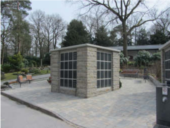
Urnenwände auf dem Waldfriedhof Reinshagen