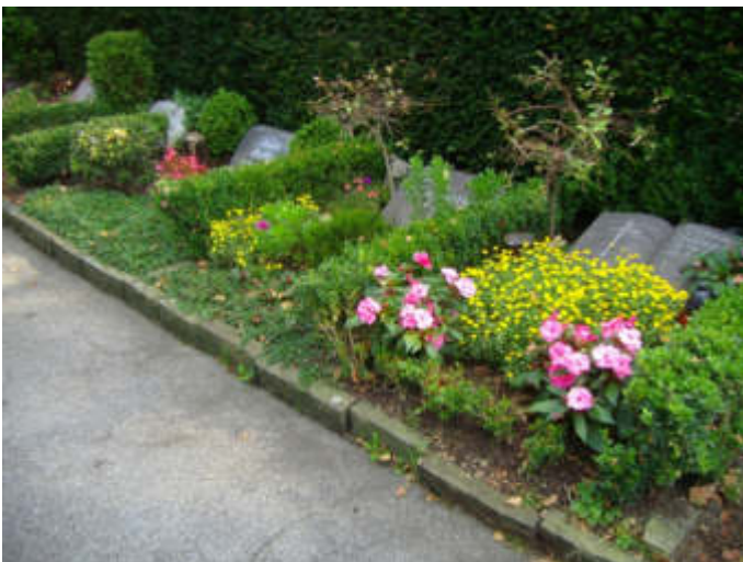
Urnenwahlgräber auf dem Parkfriedhof Bliedinghausen