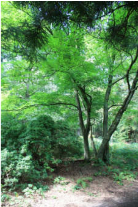
Bestattungsbaum im Begräbniswald „Im Kempkenholz“