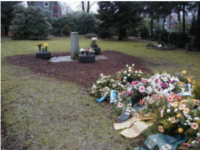
Gemeinschaftsfeld für Urnen auf dem Waldfriedhof Lennep