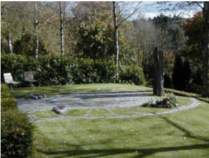
Grabfeld für totgeborene Kinder auf dem Parkfriedhof Bliedinghausen