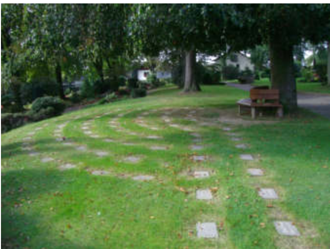
Urnen-Reihenrasengräber auf dem Waldfriedhof Lennep