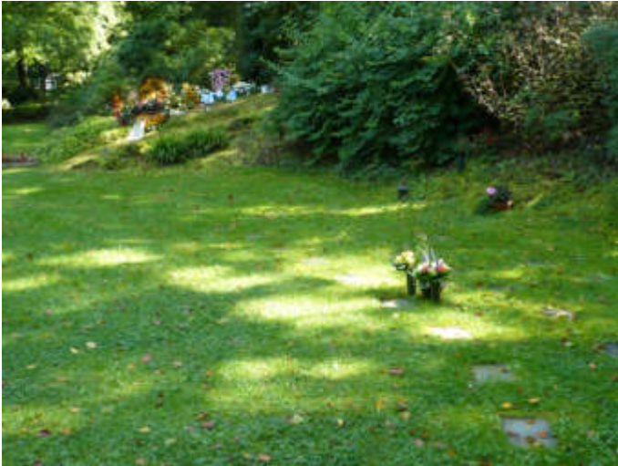
Urnen-Reihenrasengräber auf dem Waldfriedhof Reinshagen