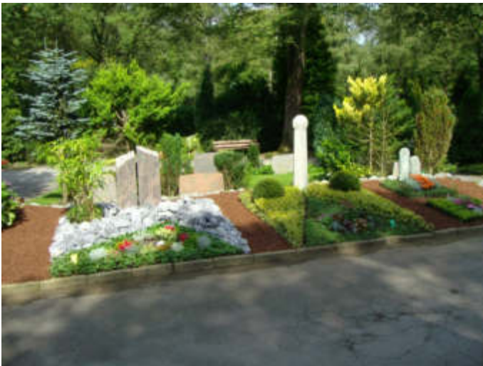
Mustergrabanlage auf dem Waldfriedhof Reinshagen